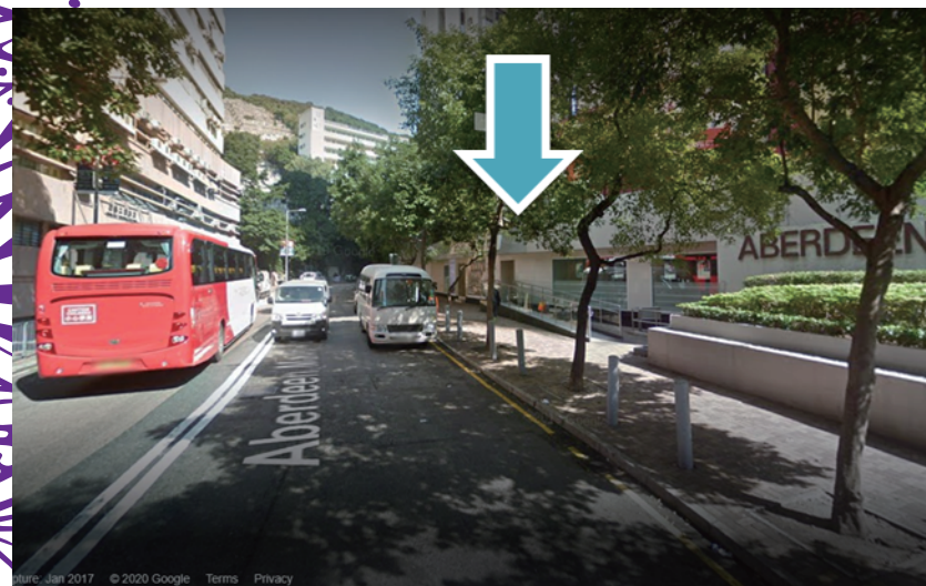
香港仔穿梭巴士侯車處 (圖1)